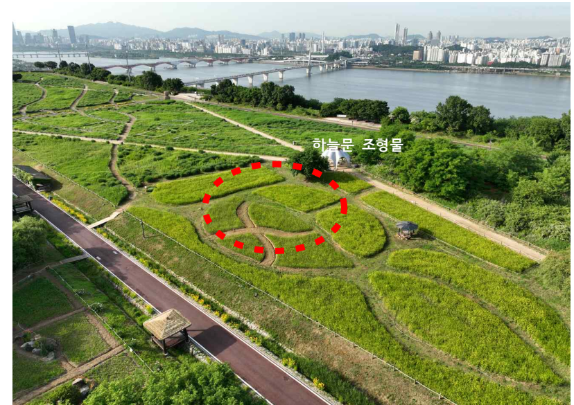
학생정원 아이디어 공모 대상지 현황사진